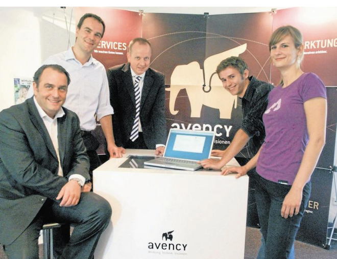
Die Macher des „Münster zeigt Größe“-Internetauftritts bei der Vorführung der neuen Webpräsenz.