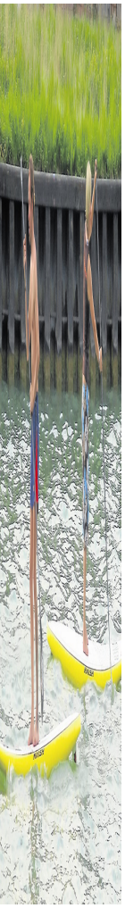
h jedoch sehr